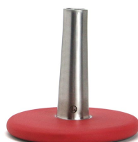
Water melon (No.N00017HWMS)