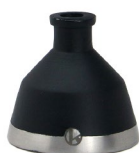
Iron Blue (No.N00017KBLUS)