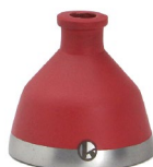
Water melon (No.N00017KWMS)