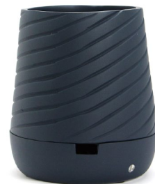
Iron Blue (No.N00018DBLUS)