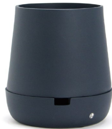
Iron Blue (No.N00018PBLUS)

ソーサーと一体のフォルムとなるアルミ製鉢。シンプルな表面にした『プレーン』と「斜め、対角線」という意味のある『ダイアゴナル』の2型2色展開。径15mmの大きな底穴が3箇所あり排水性に優れた仕様。底穴1箇所へ給水ヒモを通しソーサー部分に水を入れれば自動給水も可能で観葉植物の管理も手間も簡単に。(給水ヒモは付属していません) ソーサー部分へはアクセントとして karin の k マークをレーザー刻印にて施しました。*使用する事で少しずつ表面塗装が剥がれエイジングを楽しんでいただけます。