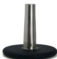
Iron Blue (No.N00017HBLUS)