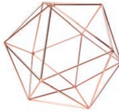
Copper "L" / ¥1,500- W23×D23×D21cm