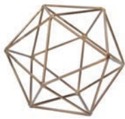
Brass "S" / ¥900- W15×D15×D14cm