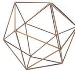
Brass "L" / ¥1,500- W23×D23×D21cm