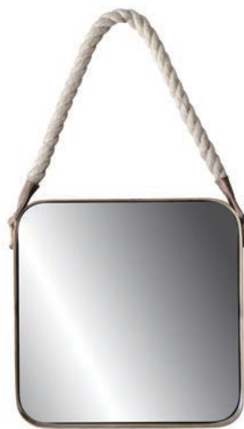
Square / ¥7,800- W31×D5×H31cm