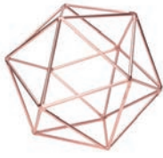
Copper "S" / ¥900- W15×D15×D14cm