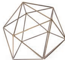
Brass "M" / ¥1,200- W18×D18×D17cm