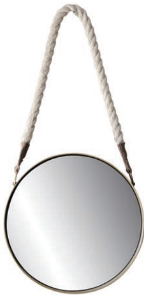
Round / ¥6,800- ø31×D5cm