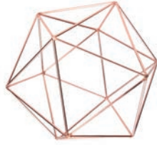
Copper "M" / ¥1,200- W18×D18×D17cm