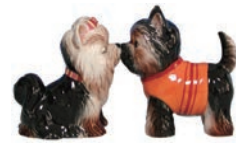
Yorkshire Terriers W14×D4.5×H8cm